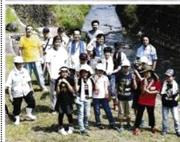
ロータリークラブのメンバーとエコクラブの子どもたち

環境活動 綾瀬ロータリークラブ 護岸清掃で協力 ロータリークラブとエコクラブ 綾瀬市にある目久尻川沿いの雑木林に、5月に実施された「鮎の稚魚放流事業」の記念撮影。今回は、ロータリークラブのおじさん達といっしょに、河川敷の草かりとゴミ拾いを行いました。 ロータリークラブのメンバーとエコクラブの子どもたち